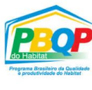
Entre as maiores empresas de consultoria PBQP-H no Brasil